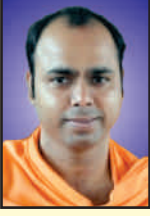
ಪರಮಪೂಜ್ಯ ಜಗದ್ಗುರು ಸ್ವಸ್ತಿಶ್ರೀ