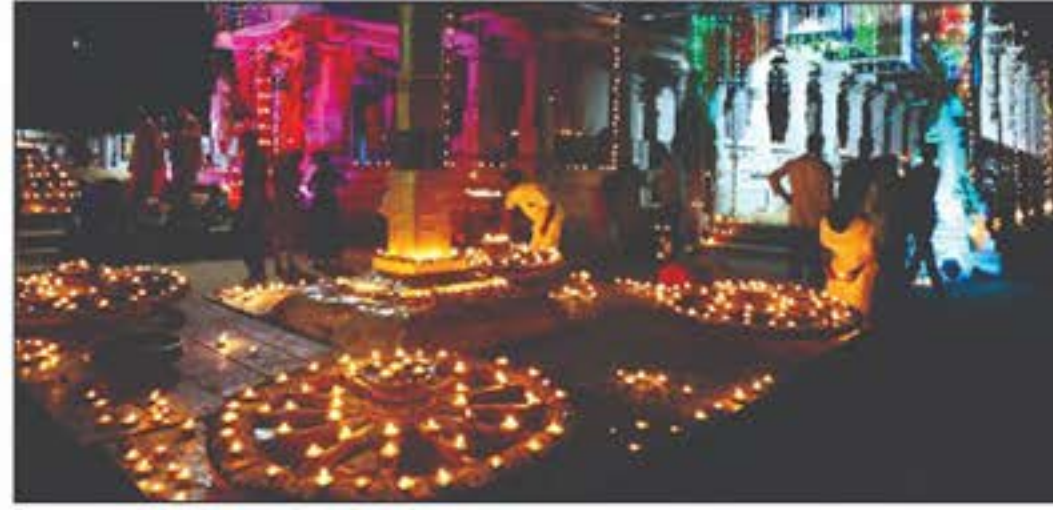
ಲಕ್ಷದೀಪೋತ್ಸವದ ಒಂದು ನೋಟ.