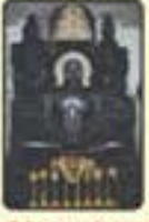
ಭಗವಾನ್ ಶ್ರೀ ಪಾರ್ಶ್ವನಾಥ ಸ್ವಾಮಿ