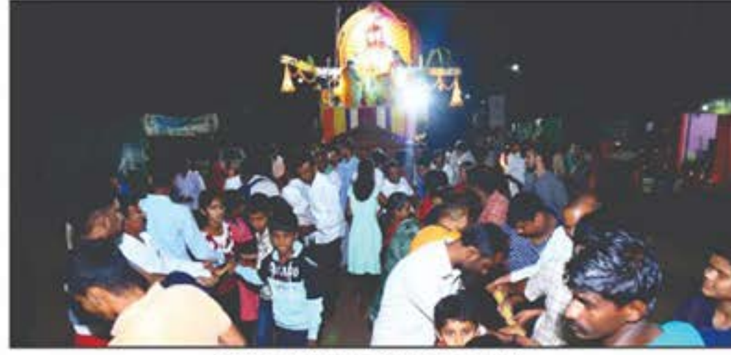
ದೀಪೋತ್ಸವದಂದು ಅಧ್ಯಪಲ್ಲಕ್ಕಿ ಉತ್ಸವ.