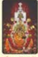
ಜಗದ್ಗುತೆ ಶ್ರೀ ಪದ್ಮಾವತಿ ದೇವಿ