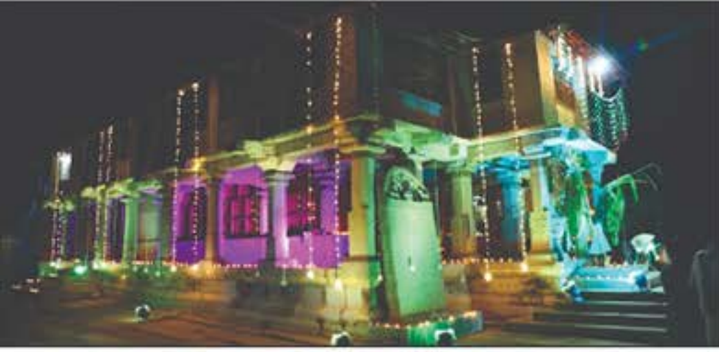
ವಿದ್ಯುತ್ ದೀಪಗಳಿಂದ ಕಂಗೊಳಿಸುತ್ತಿರುವ ಶ್ರೀಮಠ.