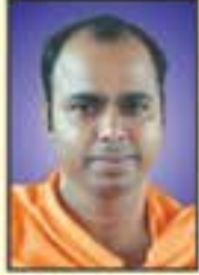
ಪರಮಪೂಜ್ಯ ಜಗದ್ಗುರು ಸ್ವಸ್ತಿಶ್ರೀ