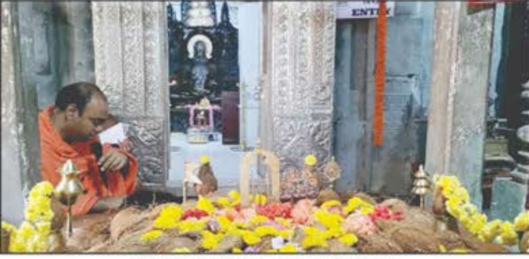
ದೀಪೋತ್ಸವ ನಿಮಿತ್ತ ಶ್ರೀ ಶಾಂತಿನಾಥ ವಿಧಾನ.