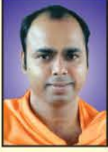
ಪರಮಪೂಜ್ಯ ಜಗದ್ಗುರು ಸ್ವಸ್ತಿಶ್ರೀ