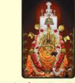
ಜಗನ್ಮತೆ ಶ್ರೀ ಪದ್ಮಾವತಿ ದೇವಿ