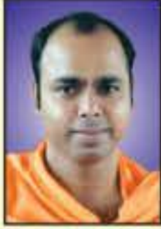
ಪರಮಪೂಜ್ಯ ಜಗದ್ಗುರು ಸ್ವಸ್ತಿಶ್ರೀ