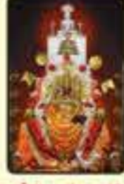
ಜಗನ್ನಾಥ ಶ್ರೀ ಪದ್ಮಾವತಿ ದೇವಿ