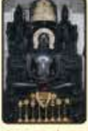
ಭಗವಾನ್ ಶ್ರೀ ಪಾರ್ಶ್ವನಾಥ ಸ್ವಾಮಿ