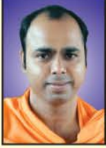
ಪರಮಪೂಜ್ಯ ಜಗದ್ಗುರು ಸ್ವಸ್ತಿಶ್ರೀ