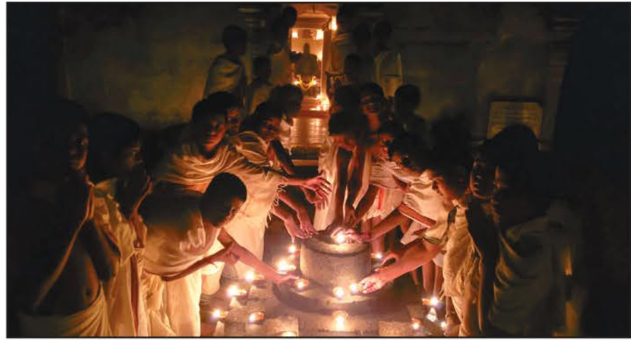
ಬೋಗಾರ ಬಸದಿಯಲ್ಲಿ ದೀಪೋತ್ಸವ

ನೂತನ ಮಾನಸ್ಸಂಭ ಹಾಗೂ ಚತುರ್ಮುಖ ಜನಜಂಬ ಮತ್ತು ಧಾಮಸಂಪೋಕ್ಷಣ ಹಾಗೂ ಪಂಚಕಲ್ಯಾಣ ಪ್ರತಿಷ್ಠಾ ಹಾಗೂ ವೇದಿ ಪ್ರತಿಷ್ಠಾ ಮಹಾಮಹೋತ್ಸವ