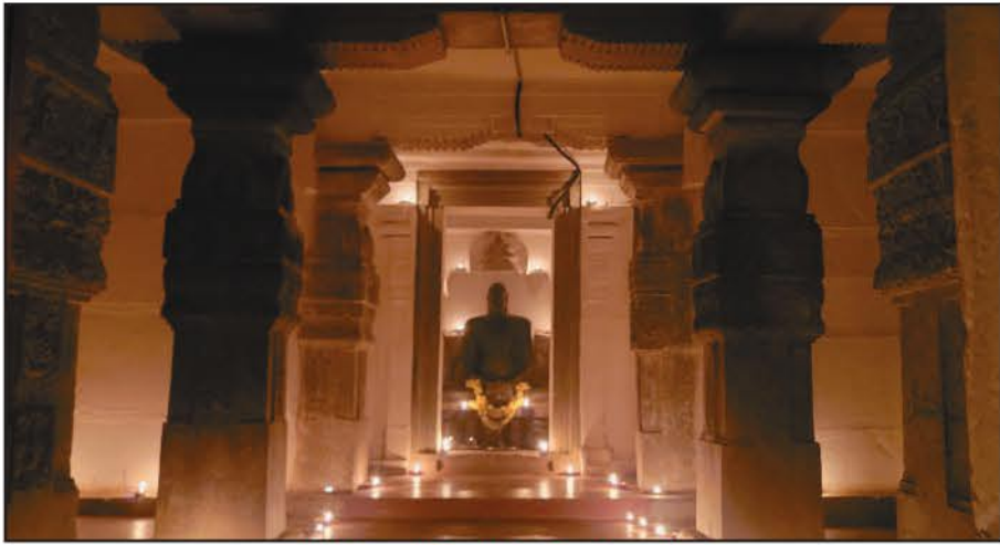
ಮಕ್ಕಳ ಬಸದಿಯಲ್ಲಿ ದೀಪೋತ್ಸವ