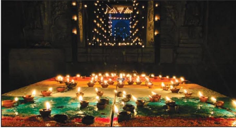
ಅಧೀನ ಕ್ಷೇತ್ರ ವರಂಗದಲ್ಲಿ ದೀಪೋತ್ಸವ